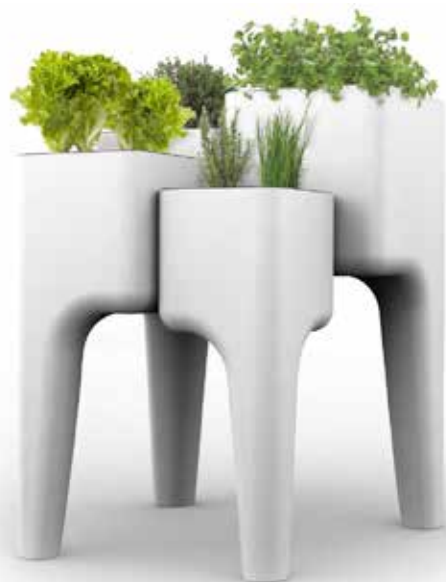
Fabriquée en polypropylène, la jardinière est traitée anti UV et équipée d'un système d'évacuation et de filtration du surplus d'eau.

L'entrepreneur anticipe l'avenir en lançant des produits dérivés : semences bio, set de jardinage ou encore la Kan Collection, série de boîtes contenant graines et terreau. ♣