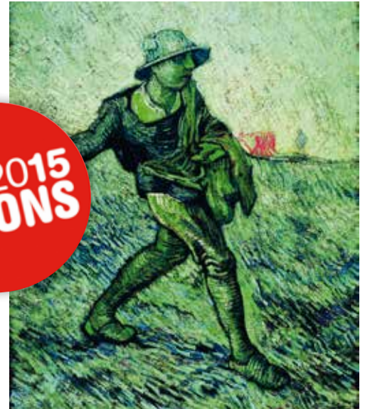
Expo Van Gogh

Des sculptures monumentales, au café-labo numérique en passant par un concert d'Adamo... Qu'on se le dise : il y a en aura pour tous les publics, tous les âges, toutes les sensibilités et toutes les envies !