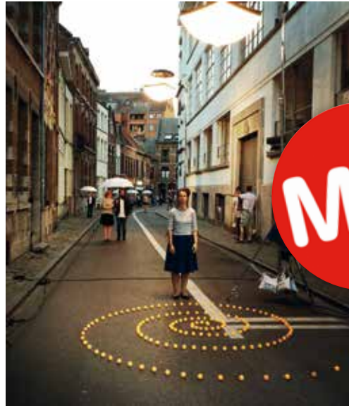
Mons street review

Se voulant à la hauteur du prestigieux titre qui lui est conféré, Mons a concocté un programme ambitieux et très éclectique. Pas moins de 300 manifestations vont prendre place au cœur de la cité, dans sa périphérie ainsi que dans 18 autres villes de Wallonie, de Flandre et du nord de la France, partenaires de l'événement.