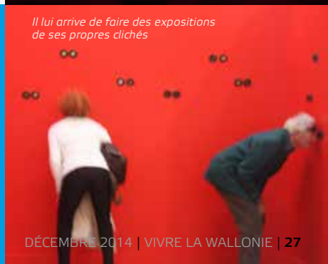
Il lui arrive de faire des expositions de ses propres clichés